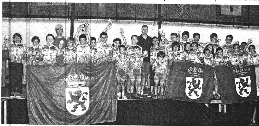
El Club Ciclista León ondeó orgulloso la bandera de León en Albardi (Asturias), una cita de la que regresó cargado de trofeos.