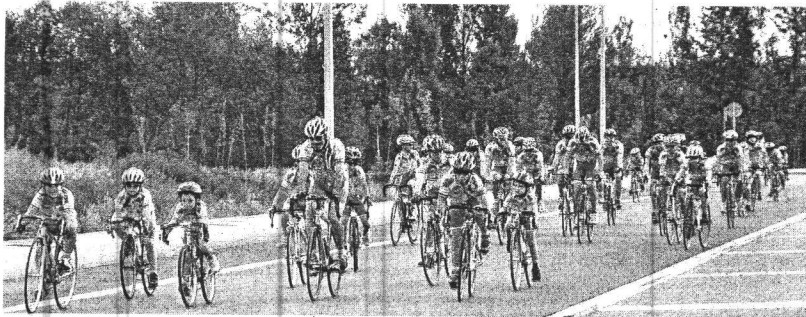
El equipo leonés, que tiñe las carreteras de rojo y amarillo, durante un entrenamiento en la Lastra.