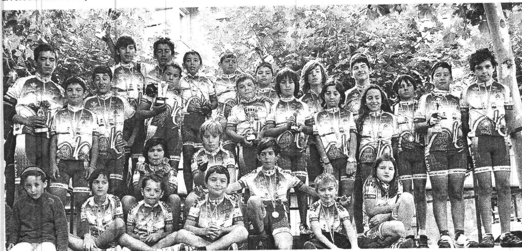
Es casi imposible sumar más victorias que el Club Ciclista León esta temporada; cada semana dan nuevas victorias al deporte leonés. L.C.

rase, ofrece un balance que arroja tras estas dos últimas carreras la victoria número cien con hasta catorce ciclistas diferentes y los ya