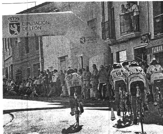
El pelotón, en uno de sus pasos por la línea de meta.

El Club Ciclista León ha completado una temporada realmente espectacular a todos los niveles, sumando títulos en cada desplazamiento y en cada prueba que competía. Tantos trofeos ha traído este año a las vitrinas del deporte leonés que será difícil repetir otro igual. Con un equipo tan laureado se corre el riesgo de no valorar en su justa medida lo alcanzado hasta ahora, que era impensable hasta hace bien pocos años. Y, por tanto, en un futuro se echará de menos a este equipo. ✽